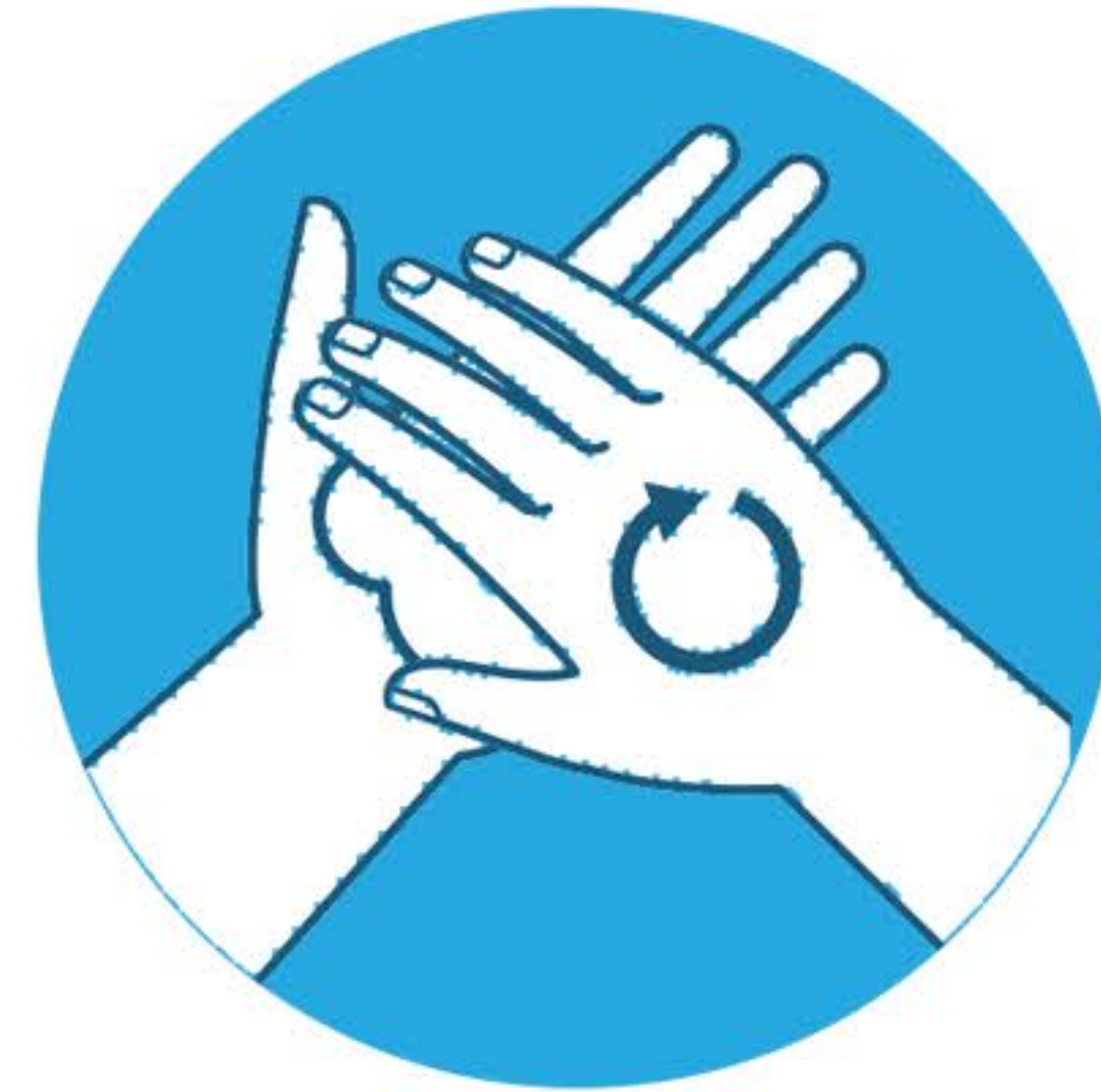
Strofina le mani palmo a palmo