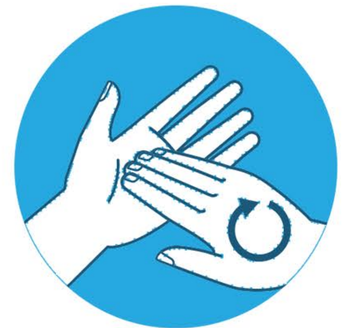
Lavare unghie e polpastrelli