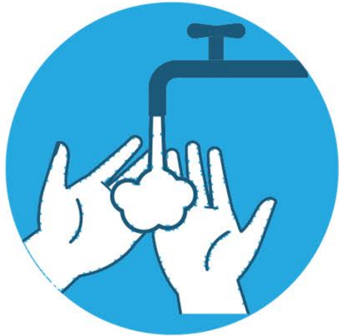
Bagna le mani