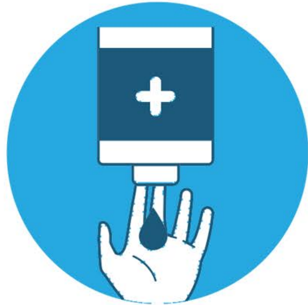
Applica il sapone