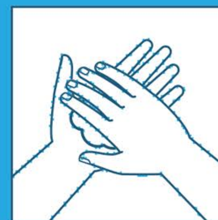
Strofinare le mani insieme