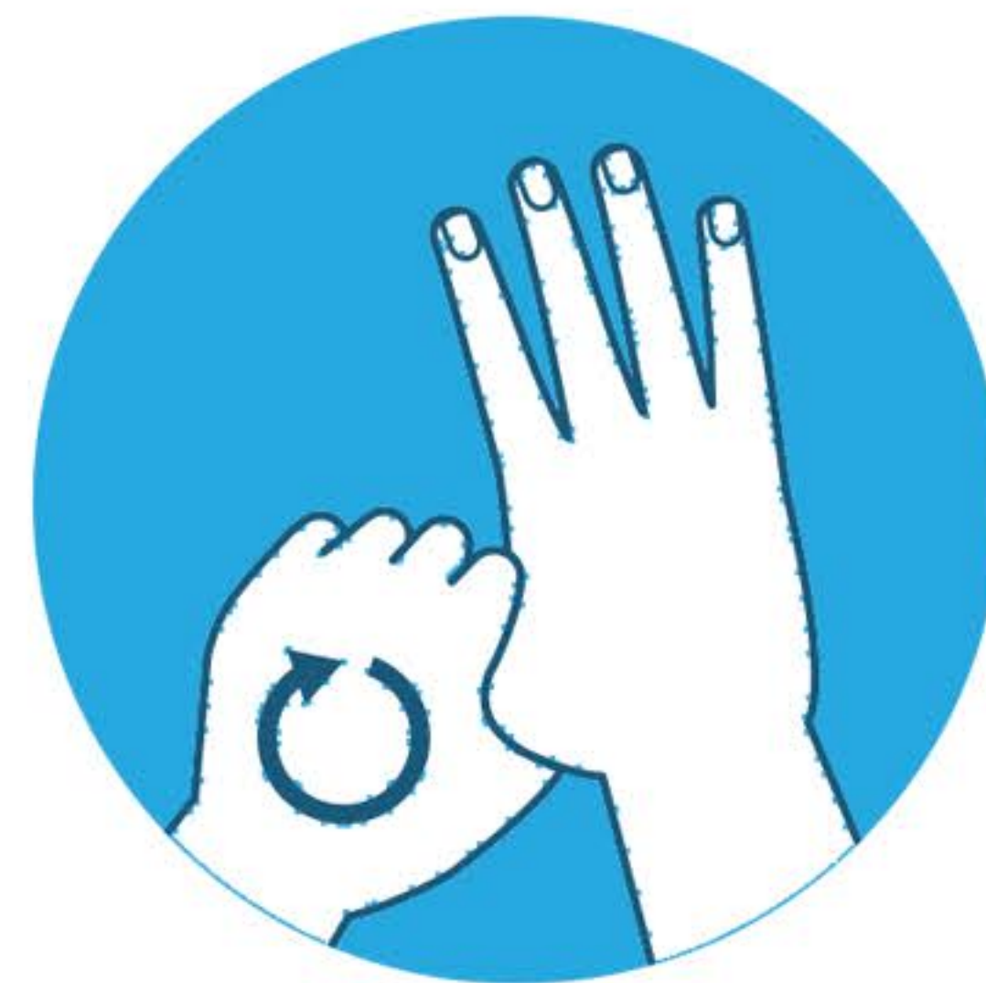
Lavare i pollici