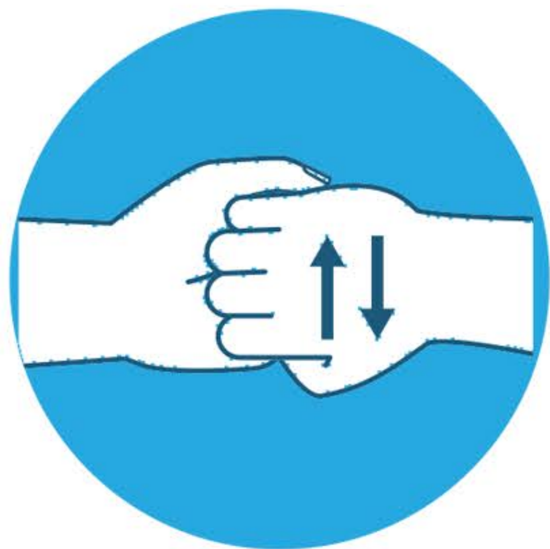
Strofina la parte posteriore delle dita