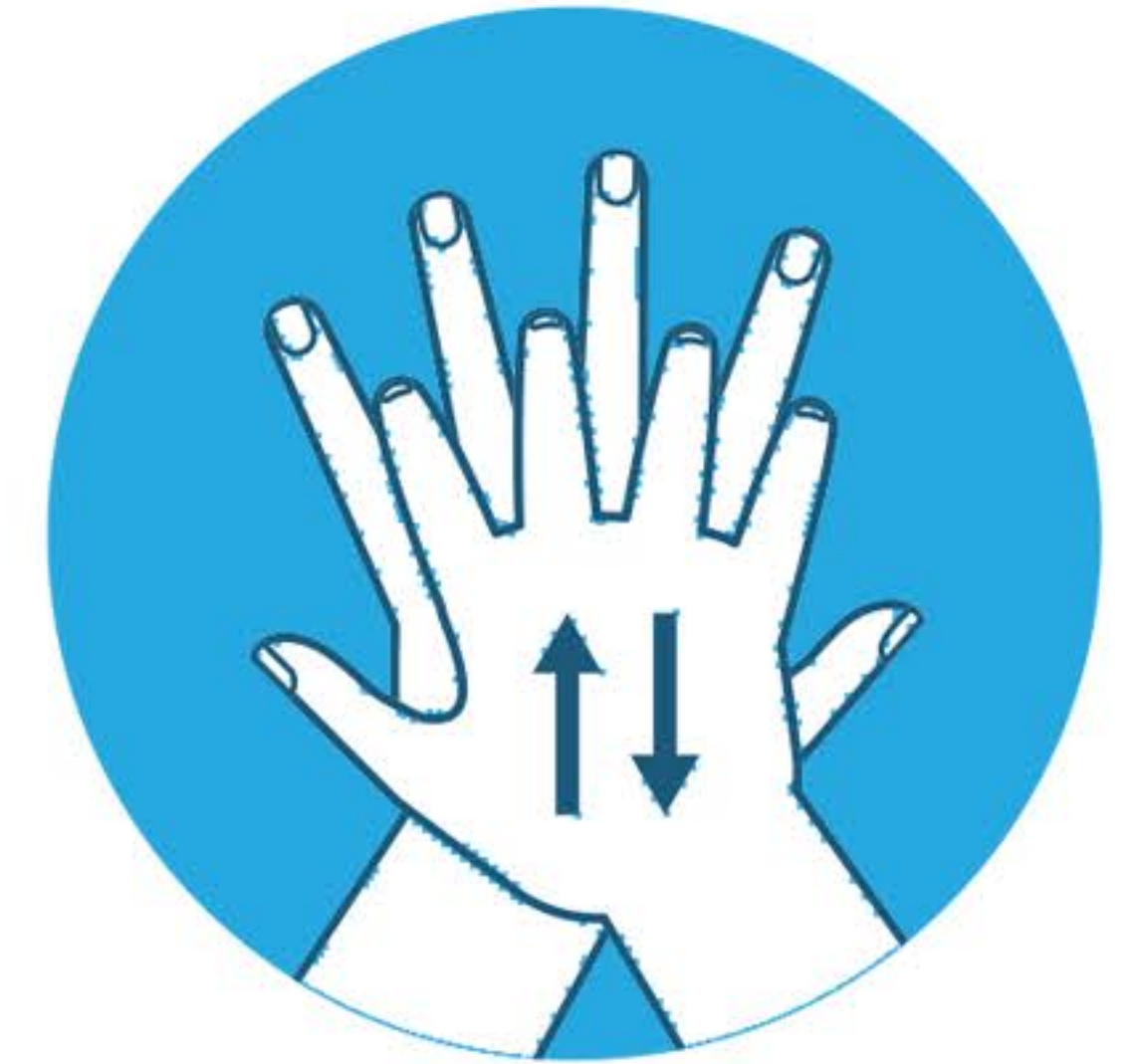
Insapona il dorso delle mani