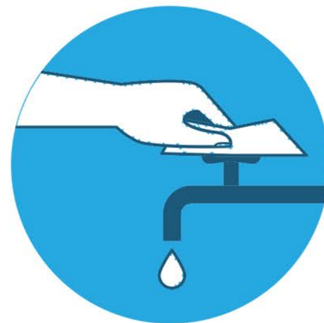
Usare l'asciugamano per chiudere il rubinetto