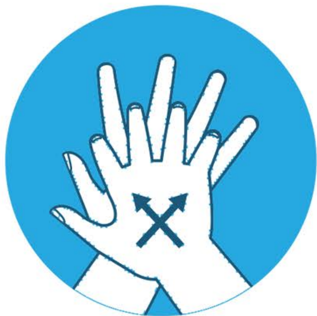
Strofina tra le dita