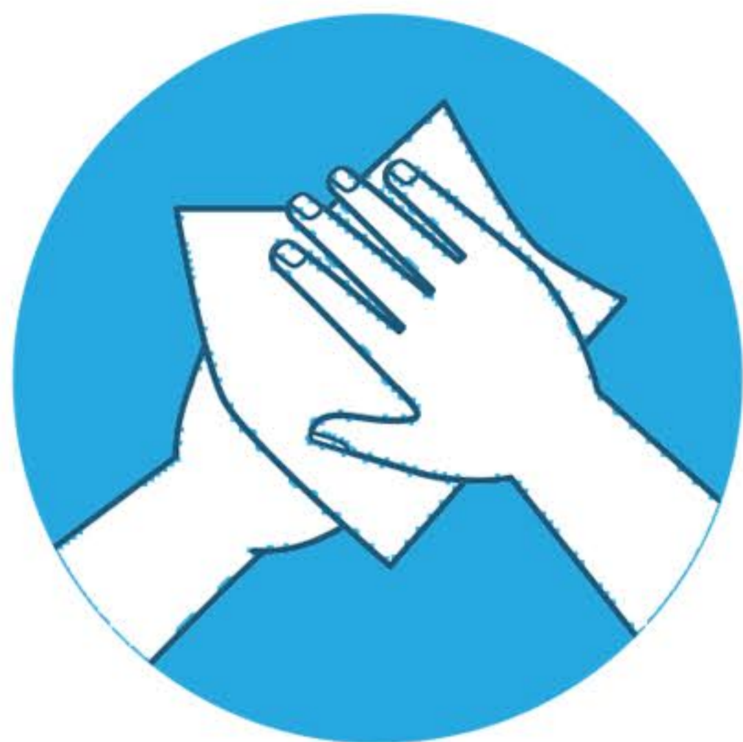
Asciugare le mani con un asciugamano monouso