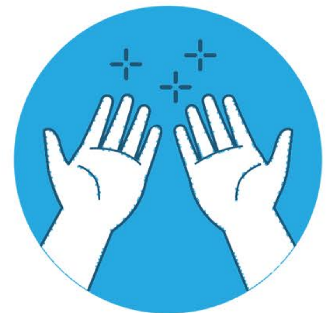
Le tue mani sono pulite