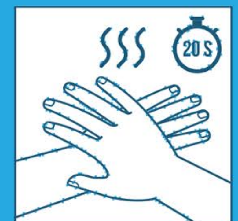
Strofinare fino a quando non sono asciutte (20 sec.)